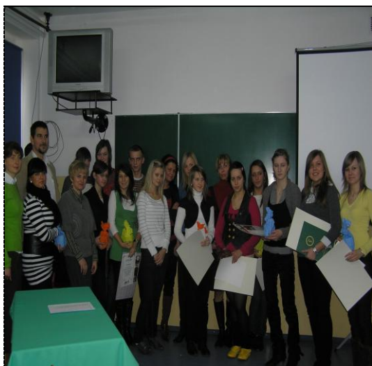
Uczniowie ZSP biorący udział w inicjatywach ekonomicznych

Gimnazjaliści podczas „Drzwi Otwartych” mogli zwiedzić szkołę, zapoznać się z każdą pracownią. Pracownia ekonomiczna cieszyła się dużym zainteresowaniem. Uczniowie mogli uzyskać informację na temat Technikum Ekonomicznego od uczniów klas: IV, III i II, sprawdzić swoją wiedzę podczas rozwiązywania zadań, krzyżówek i rebusów z zakresu ekonomii.