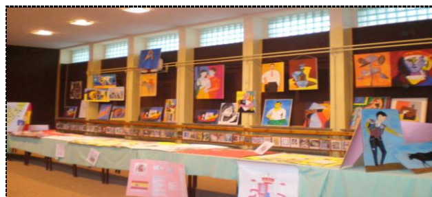
ogólny widok wystawy